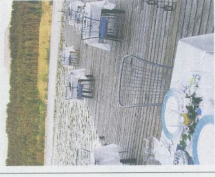
Schlemmen und genießen direkt am Gösselsdorfer See

Das erste Dinner findet am 31. Mai statt – wenn das Wetter mit- spielt. Treffpunkt: 19 Uhr am Campingplatz. Weitere Infos unter Telefon: 0 66 4/87 47 250