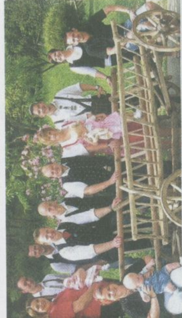
Umbund und die Jugend aus St. Margarethen organisieren die Fahrzeugweihle in Grablach

Feuerwehrzeitfest der FF Greutschach in Greutschach am 2. und 3. August . Beginn: 20 bzw. 10 Uhr .