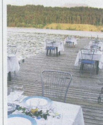
Schlemmen und genießen direkt am Gösselsdorfer See

Das erste Dinner findet am 31. Mai statt – wenn das Wetter mit- spielt. Treffpunkt: 19 Uhr am Campingplatz. Weitere Infos unter Telefon: 0 66 4/87 47 250