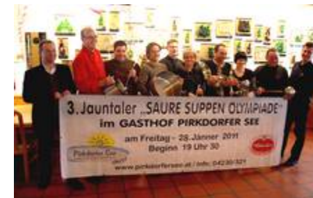
SAURE SUPPN WIRTE